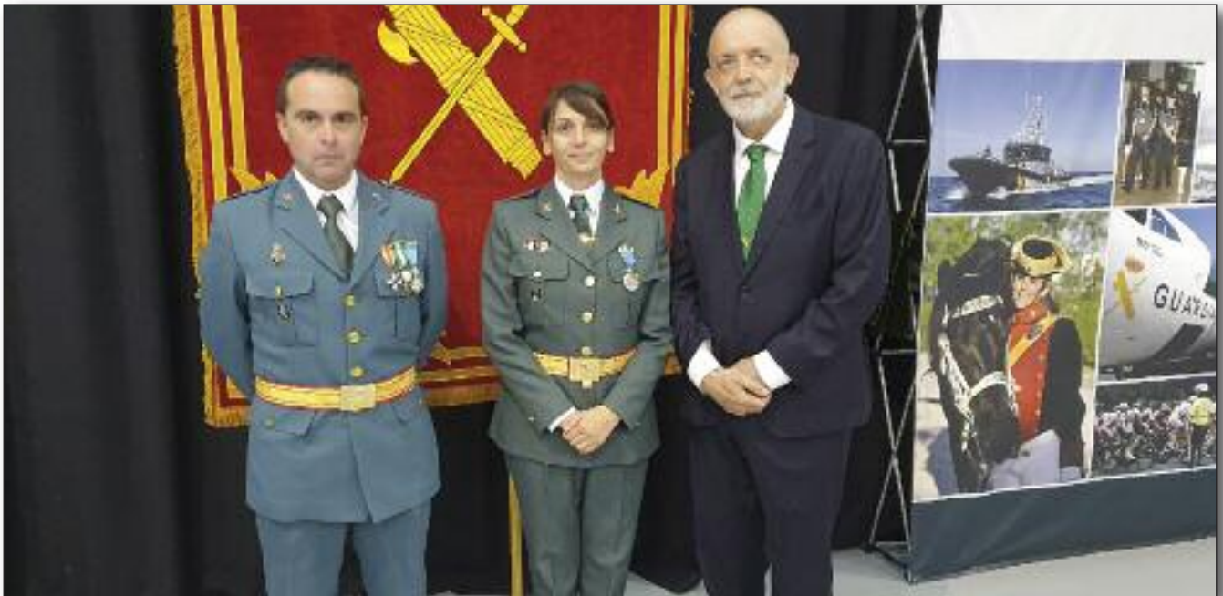
Director General y RAGCE en Huesca.

R AGCE es una asociación formada por mujeres y hombres Guardias Civiles en situación de Retiro, bien por haber alcanzado la edad (actualmente sólo se da ese caso en hombres, dado que la mujer Guardia Civil ingresó en el Cuerpo hace 30 años y por lo tanto todavía no tenemos mujeres que hayan cumplido los 65 años), por accidente en acto de servicio o por enfermedad (pérdida de actitudes psicofísicas). No podemos olvidar a nuestras viudas y viudos, que han jugado y juegan un papel fundamental en la historia de la Guardia Civil.