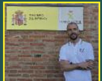
Entrevista diario Palentino