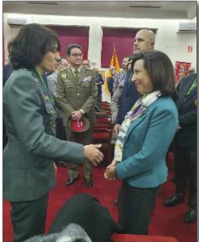
Ministra de Defensa ACIME.

RAGCE ha gritado ALTO, CLARO Y FUERTE, desde el RESPETO y desde LOS