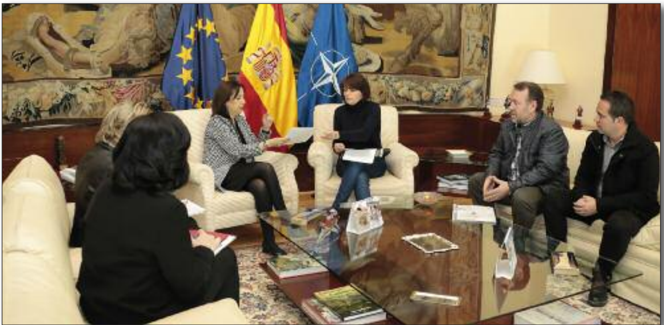
Ministra de Defensa.

Se debe de empezar a inculcar el respeto y el cariño hacia quiénes han sido compañer@s de armas y que además continúan siendo guardias civiles