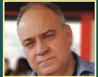
Entrevista al Presidente de (IGC), el Sargento Joaquín Parra Cerezo