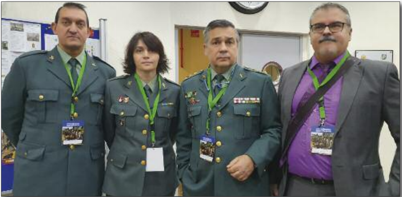
Coronel Herrero SAS.

con distintos políticos de algunas Provincias. Este escrito fue entregado al mismo tiempo al Director General de la Guardia Civil, así como a la Ministra de Defensa y al Ministro del Interior, siendo recibidos inmediatamente, tratados con cariño y con la voluntad de ayudarnos en nuestras demandas.