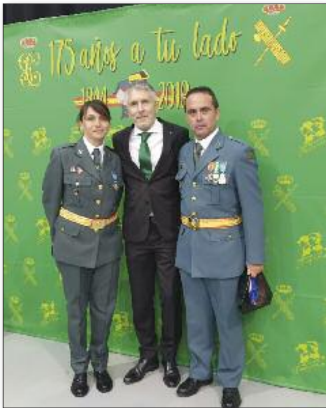
Ministro Marlaska, Huesca 2019.

capacidad. Entre estos convenios podemos hablar de: Teleasistencia; Reparto de comida a domicilio; Reparto de medicamentos a domicilio; Tramitación para disfrutar del Termalismo Social a lo que tienen derecho dos veces al año; Gestión de solicitud de ayuda con Caritas Castreña; Descuentos en Transporte, empresas, agencias de viaje, etc. Quiénes formamos RAGCE estamos volcados en un plan social y solidario. Uno de nuestros lemas es “seguimos aportando”. Estamos Retirad@s, pero somos profesionales con formación y experiencia que podemos contribuir a nuestra sociedad. Hemos recuperado la ilusión de continuar hacia delante y de trabajar duro para no volver a caer en el olvido.